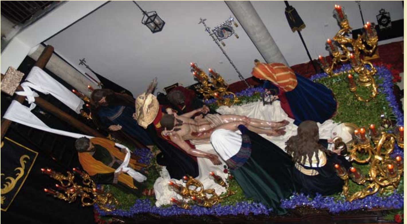
En la imagen, nuestro paso preparado para la primera salida del Viernes Santo del 2007. Como se puede observar, la disposición de las imágenes difiere de la actual, permuta que se realizó con objeto de distribuir el peso de las mismas de forma más equilibrada.