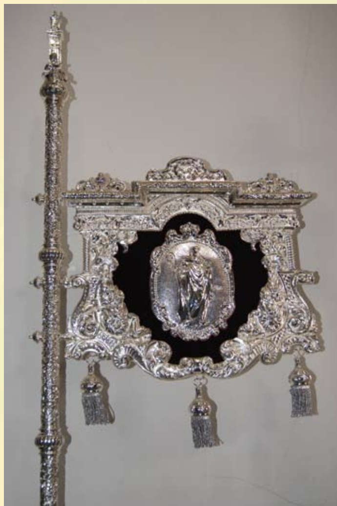
Guión juvenil de San Bernardo

¡Buena estación de penitencia hermanos cofrades!